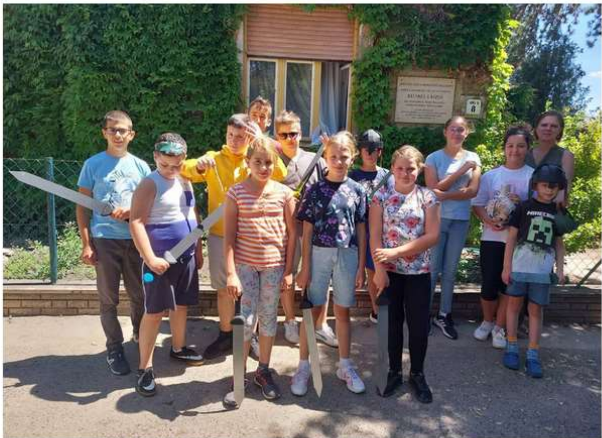
KOMÁROMI KLAPKA GYÖRGY MÚZEUM